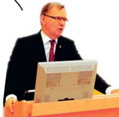
Lars Bäckström, landshövding